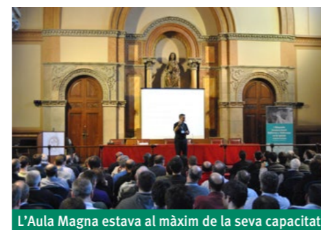
L'Aula Magna estava al màxim de la seva capacitat

Amb uns dots extraordinaris de comunicació i una passió contagiosa, el pare Mallon s'ha ficat tothom a la butxaca des del minut zero: «L'Església existeix per fer deixebles, per evangelitzar —recordava—, i justament això és el