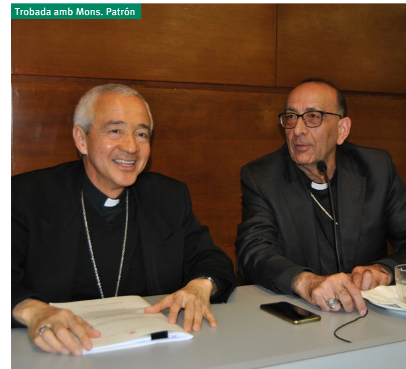
Trobada amb Mons. Patrón