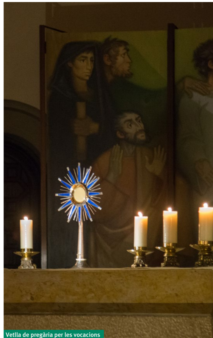
Vetlla de pregària per les vocacions