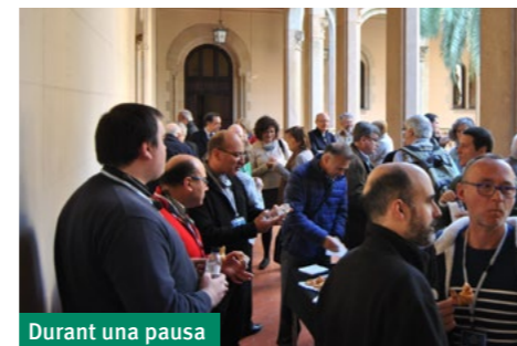
Durant una pausa

no us deixeu endur per la temptació d'esdevenir mers funcionaris, no deixeu de somiar que el canvi és possible!», ha insistit a recordar una vegada i una altra el pare Mallon. «M'agradaria deixar clar que no tinc totes les respostes —ha reconegut també— però les que tinc crec que són millors que les que s'estan aplicant a molts llocs. Fa vint anys que sóc capellà, he après dels meus errors i he conegut molta gent.» Davant d'un auditori expectant, el sacerdot canadenc ha animat els capellans i seminaristes assistents a esdevenir veritables líders de les seves comunitats, molt conscients de la seva vulnerabilitat però alhora capaços de dirigir equips pastorals de cara a l'evangelització.