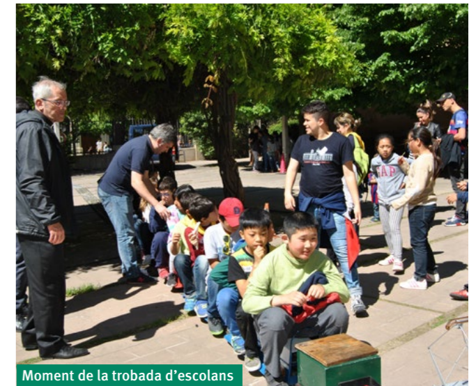
Moment de la trobada d'escolars

didado verificar cómo el Señor se vale de cualquier circunstancia para salir a nuestro encuentro, como le sucedió a Mateo, que mientras estaba en su faena de recaudador de impuestos el Señor se fija en él y le llama; o cómo en los cuatro primeros seguidores del Señor, Pedro, Andrés, Juan y Santiago que mientras están en su faena de pescadores, el Señor sale a su encuentro. Es cierto que es muy pronto para concretar esta inquietud, por ello existe este espacio del seminario menor en familia, para los que tienen una inquietud más clara. También contamos con el espacio Samuel, en el cual, vienen un domingo al mes, monaguillos que quieren participar de nuestra compañía y verificar a qué les llama el Señor. En cada encuentro del grupo Samuel, visitamos alguna parroquia de la diócesis de Barcelona o Sant Feliu de Llobregat, para que conozcan la realidad de la parroquia y a la vez que nos conozcan. Agradecemos la acogida que hemos tenido en las diferentes parroquias que hemos visitado.