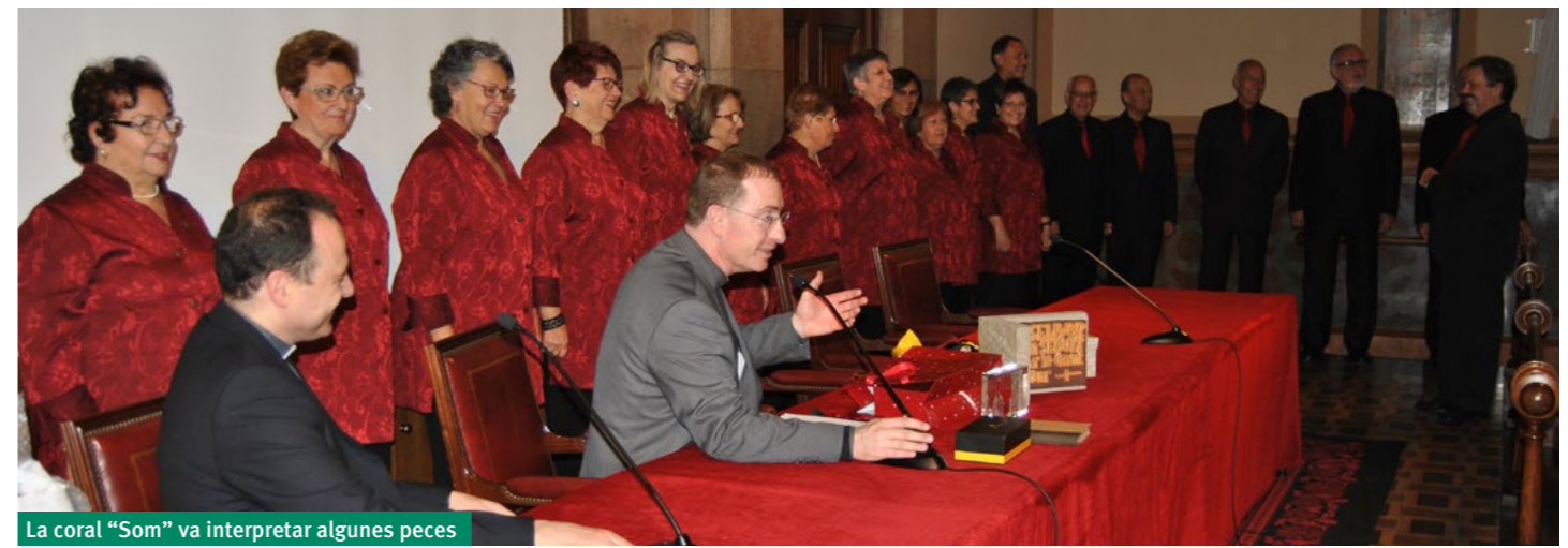
La coral "Som" va interpretar algunes peces

dels feligresos de les parròquies de la Mare de Déu dels Àngels i de Sant Ramon de Penyafort li van fer entrega d'un cristall on hi ha gravada una imatge de la façana de les dues parròquies. Va ser un regal que li permetrà recordar sempre els anys dedicats a aquestes comunitats cristianes. El Seminari li va fer entrega d'un estoig amb tres instruments d'escriptura molt elegants: un bolígraf, un roller i un llapis de mina. El darrer obsequi va ser molt especial, d'aquells que no es poden embolicar. Es tractà de la coral "Som", que havia estat a la Parròquia de Sant Ramon de Penyafort,