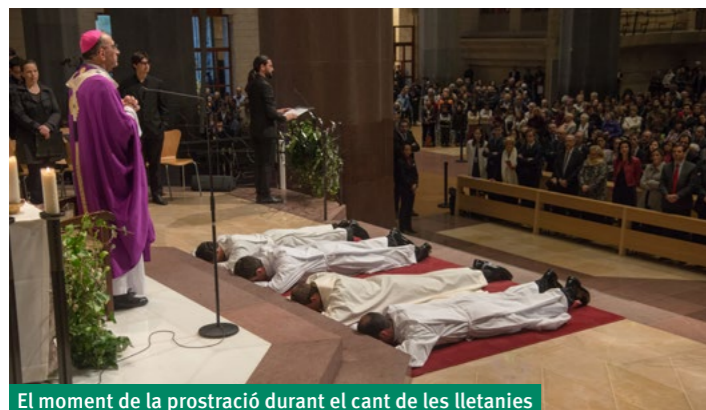
El moment de la prostració durant el cant de les lletanies

Els mots d'aquest verset del salm 94, aquell dia, vam poder viure'ls amb molta intensitat, ja que d'una manera o altra podíem afirmar tots quatre que, efectivament, vam sentir la veu del Senyor, una veu que es manifestava en la veu de l'Església cridant-nos al ministeri ordenat, al