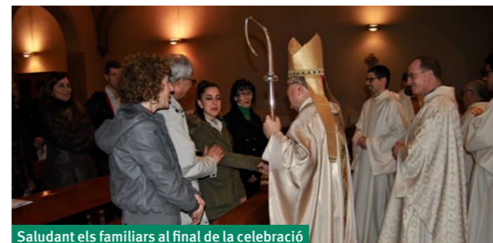
Saludant els familiars al final de la celebració