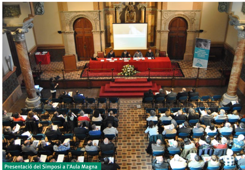
Presentació del Simposi a l'Aula Magna

L'Església a Occident està malalta. Pateix des de fa temps diverses patologies que es manifesten sobretot en la seva manca de vitalitat i de fruit apostòlic. L'Església avui viu una crisi pregona d'identitat: ha perdut de vista que la seva vocació primera és fer deixebles missioners i s'ha convertit en un sanatori. La mera pastoral de manteniment, autoreferencial i centrípeta, no porta enlloc, cal una renovació radical, una conversió pastoral en la línia del que han demanat els darrers sants pares, des de Joan XXIII fins al papa Francesc.