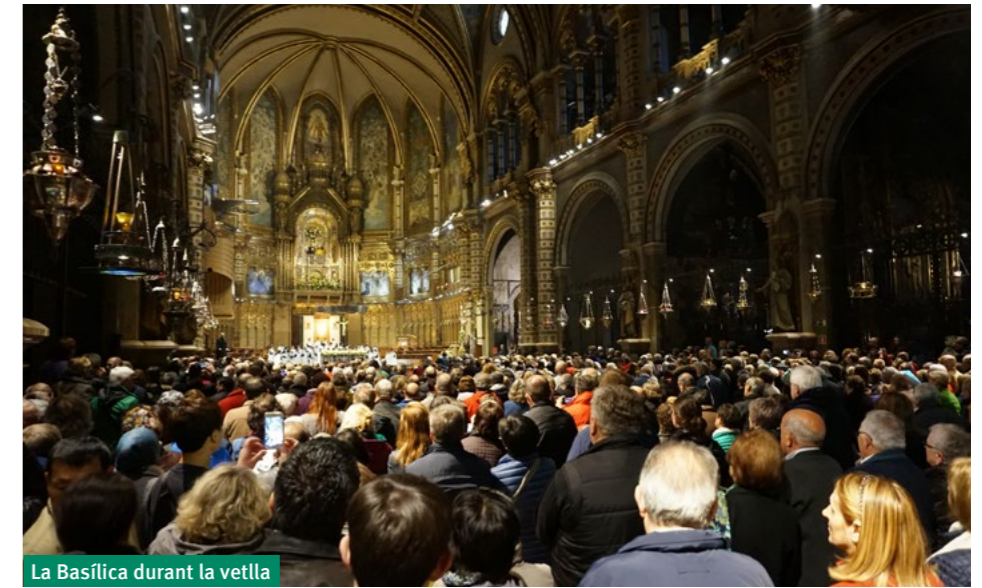
La Basílica durant la vetlla

d'història amb tot un repertori de música medieval. Així doncs, mica en mica s'anava aconseguint el clima desitjat per a poder fer la Vetlla.