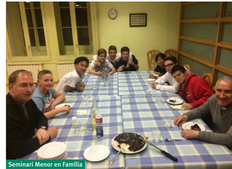
Seminari Menor en Família

Continuamos nuestros encuentros con el seminario menor en familia, en el cual, un fin de semana al mes participan chavales que tienen inquietudes por la vocación sacerdotal. Este año, en nuestras catequesis, hemos conocido a los personajes bíblicos del Antiguo Testamento y hemos iniciado con los del Nuevo Testamento. Es impresionante escuchar las experiencias de estos chicos, ya que podemos caer en la cuenta, que no hay una edad concreta, en la cual se puede sentir la llamada del Señor a la vocación sacerdotal. Hemos po-