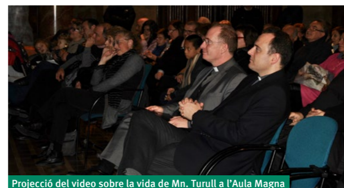
Projecció del vídeo sobre la vida de Mn. Turull a l'Aula Magna

Finalment, Mn. Turull va pronunciar unes sentides paraules d'agraïment tot glossant tres termes molt significatius: gràcies, perdó i siusplau. Aquestes paraules han estat sempre presents en l'exercici del seu ministeri i va demanar a Déu que hi continuï estant durant el futur. L'acte va acabar amb un refrigeri al claustre principal del Seminari, on tots vam poder felicitar i parlar amb l'homenatjat.