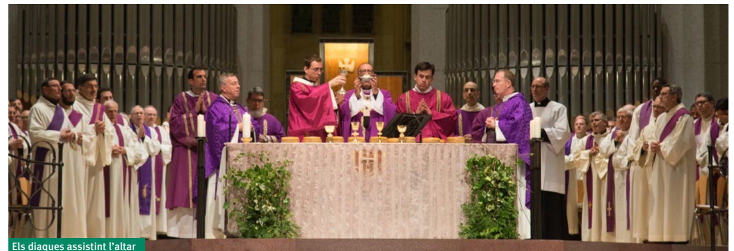
Els diaques assistint l'altar