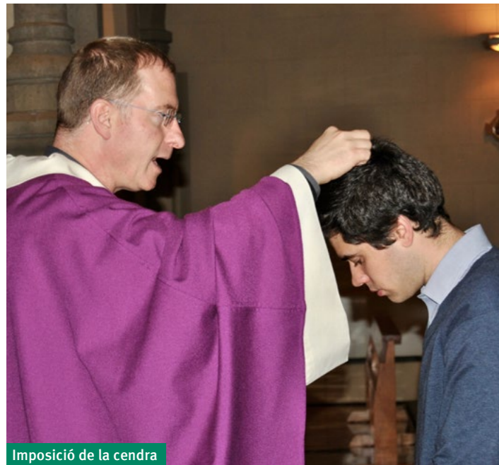
Imposició de la cendra

El passat 1 de març vam celebrar l'inici de la quaresma. Aquest dia, dimecres de cendra, té sempre per al cristià un significat molt especial. Pot semblar un dia com qualsevol altre: amb les classes i l'horari habitual, però està marcat també per uns signes externs molt característics: la sobrietat de la litúrgia, el dejuni i la abstinència de carn... Aquests signes ens porten a entrar en el seu missatge més profund: «Convertiu-vos i creieu en l'Evangeli».