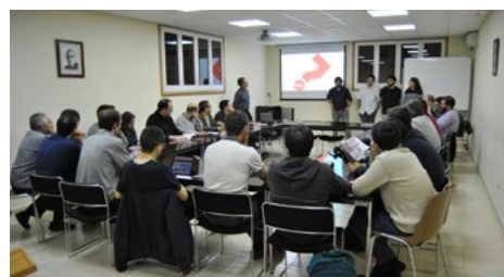
Un moment de l'exposició per part del joves de la Delegació

Degut a la continua evolució de la humanitat, la predicació evangèlica sempre ha estat un tema difícil a l'Església. Afortunadament, al llarg dels temps, molts cristians han reconegut les necessitats i costums de les seves èpoques i, amb un admirable esforç creatiu, han trobat noves i creatives formes de predicar l'Evangelí, adaptant-lo als temps actuals però sense alterar-ne el contingut. El passat dimecres dia 10 de maig, els seminaristes vam tenir l'ocasió de conèixer una d'aquestes realitats, en concret, la dels sopars Alfa.