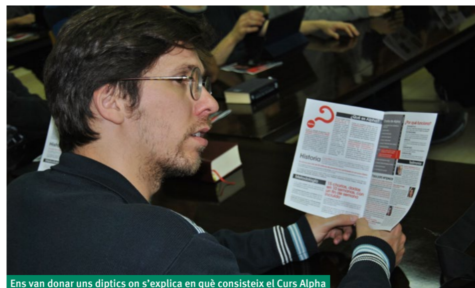
Ens van donar uns díptics on s'explica en què consisteix el Curs Alpha