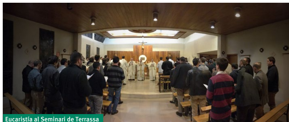
Eucaristía al Seminari de Terrassa

Una vez terminada la Misa pasamos a la mesa. Nos repartimos entre las diferentes mesas para poder disfrutar de unos deliciosos manjares con todos los seminaristas. Todo pareció acabar después de brindar y pedir para que el Señor envíe sembradores a sembrar y repartir los trofeos al equipo campeón, al mejor jugador y al mejor portero, cuando apareció una fuente de chocolate con frutas. Lo que está claro después de esta jornada es que el mejor trofeo es la fraternidad entre los seminaristas llamados a llevarla a todo el mundo.