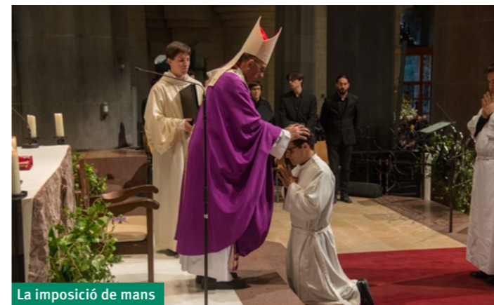
La imposició de mans