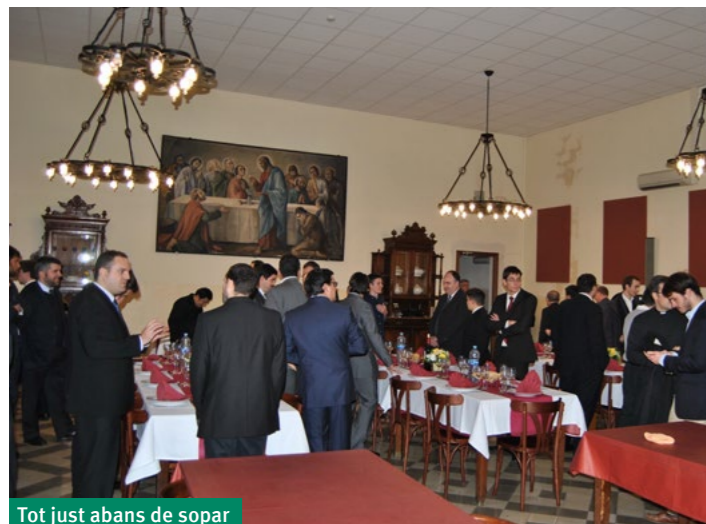
Tot just abans de sopar

Tras la celebración eucarística, tuvimos una cena acompañada de villancicos para conmemorar el nacimiento del hijo de Dios y para despedir el año 2016 dando paso a un nuevo año.