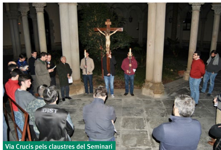
Via Crucis pels claustres del Seminari