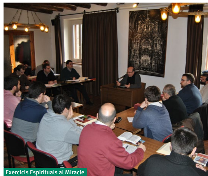
Exercicis Espirituals al Miracle

SI VOLEU COL·LABORAR AMB UN DONATIU, PODEU FER-HO AL COMPTE CORRENT 2100-1047-91-0200096265