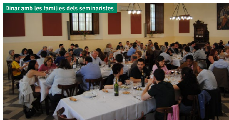
Dinar amb les famílies dels seminaristes