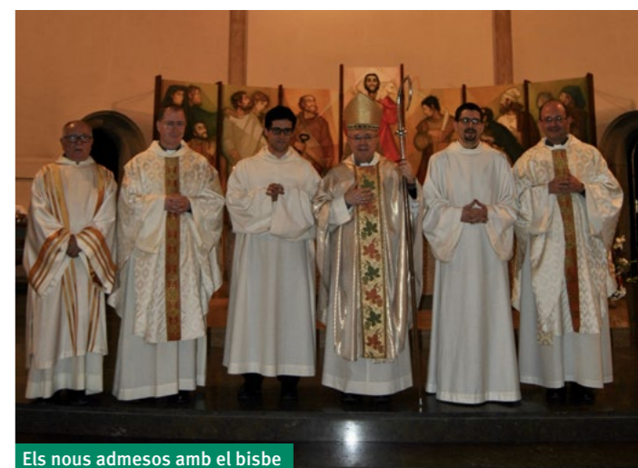
Els nous admesos amb el bisbe

en nom del meu company admès als ordes, vaig dirigir unes paraules d'agraïment a tots als assistents.