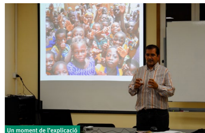
Un moment de l'explicació