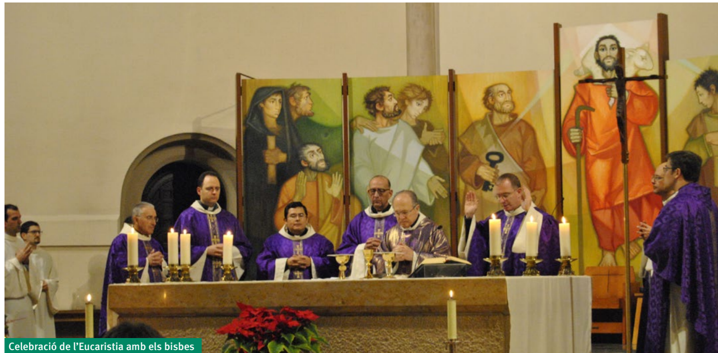
Celebració de l'Eucaristia amb els bisbes