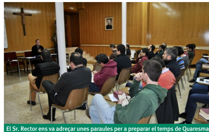
El Sr. Rector ens va adreçar unes paraules per a preparar el temps de Quaresma

L'altre és un do». El papa, tot comentant la paràbola del ric i el pobre Llätzer, se centra en tres aspectes: la valoració del proïsme com a do de Déu (malgrat les seves possibles mancances), el perill de la corrupció del pecat (l'afecció pels diners que porta a la vanitat i la supèrbia), i la importància de la Paraula de Déu («ja tenen la Llei i els profetes»). La quaresma ha de ser veritablement un temps de conversió, de tornar a Déu amb tot el cor, de créixer en l'amistat amb el Senyor. Aquesta actitud és de vital importància per aquells que ens estem preparant per el presbiterat.