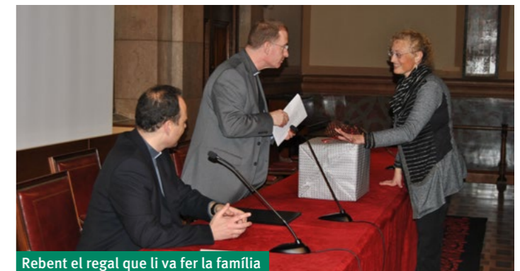
Rebut el regal que li va fer la família

que va interpretar quatre peces a veus. És una coral molt estimada per Mn. Turull, doncs és molt afecionat a la música. Posteriorment va rebre altres obsequis a títol personal d'altres persones, testimoniant així l'agraïment i l'estimació que li tenen.