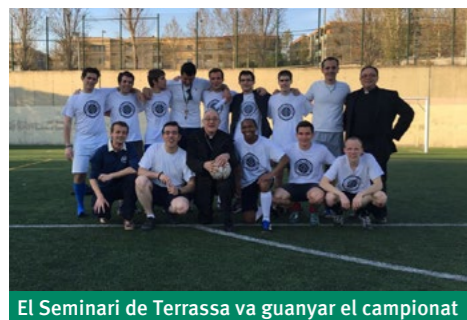
El Seminari de Terrassa va guanyar el campionat

Como cada año, la emoción aflora en los seminaristas a medida que el día de San José se acerca. Los preparativos del ansiado trofeo de fútbol van preparando el terreno para que la jornada sea fraternal, alegre y motivo de mayor unión entre los seminaristas de las diversas diócesis. Este curso, la organización de la jornada ha recaído en el Seminario de Terrassa. El planteamiento, como cada año, consiste en un torneo de fútbol durante la tarde para después proseguir con la celebración de la Eucaristía y una cena de gala para culminar los actos.