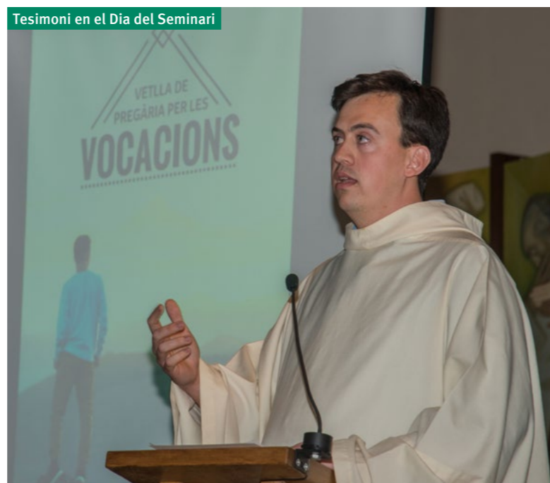
Tesimoni en el Dia del Seminari