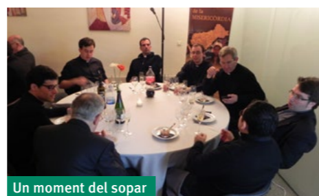
Un moment del sopar

El ambiente durante los partidos fue excelente, con cánticos de ánimo y alguna que otra broma. Los "hooligans" que no podían jugar se