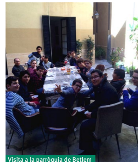
Visita a la parròquia de Betlem

Continuamos nuestros encuentros con el seminario menor en familia, en el cual, un fin de semana al mes participan chavales que tienen inquietudes por la vocación sacerdotal. Este año, en nuestras catequesis, hemos conocido a los personajes bíblicos del Antiguo Testamento y hemos iniciado con los del Nuevo Testamento. Es impresionante escuchar las experiencias de estos chicos, ya que podemos caer en la cuenta, que no hay una edad concreta, en la cual se puede sentir la llamada del Señor a la vocación sacerdotal. Hemos po-