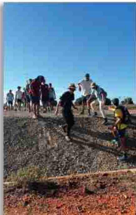
Calma! Ruta inesperada: «Se hace camino al andar». 21a etapa a la província de Ciudad Real, de Tomelloso a Manzanares (38 km)

Les jornades començaven ben d'hora. Ens llevàvem entre les 2 i les 3 de la matinada, depenent dels km de la jornada, per tal d'arribar al final d'etapa cap al migdia. Recollíem ràpidament la parada, esmorzàvem, fèiem una pregària d'oferiment del dia i uns dels mossens orientava amb uns punts de meditació la primera hora de caminada, que era en silenci fent pregària. La temàtica versava sobre la vida de Moïses, la sortida d'Egipte i la travessia del desert fins a arribar a la Terra Promesa. El Llibret de la Peregrinació ens ajudava després a seguir un itinerari espiritual ben pràctic per a la vida cristiana dels joves. En aquest llibret, cada dia se'ns proposava un text de lectura i la vida d'un sant, a més d'altres temes enriquidors per la reflexió i la convivència (cants diversos, etc.)