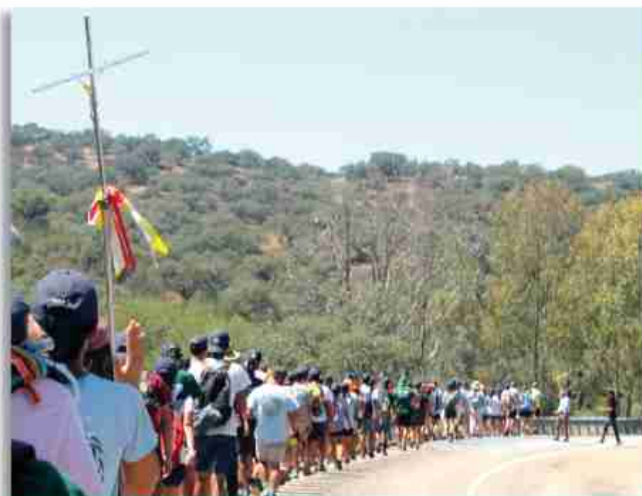
Junts en ruta ja a Portugal, 36a etapa: de Sousel a Pavla (34 km)