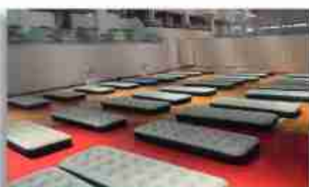
Els matalassos inflables, una gran ajuda per un bon descans. Poliesportiu de Sousel. 35a etapa, de Vila Fernando a Sousel (34 km)