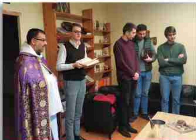
Beneint el pessebre de la residència St. Josep Oriol

fins a com es viu la litúrgia en el Seminari. Sempre em tocava presidir l'Eucaristia de Sant Bru per la tesi que continuo fent sobre la litúrgia dels monjos cartoixans.