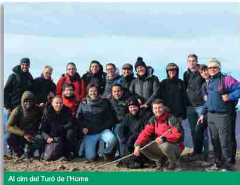
Al cim del Turó de l'Home