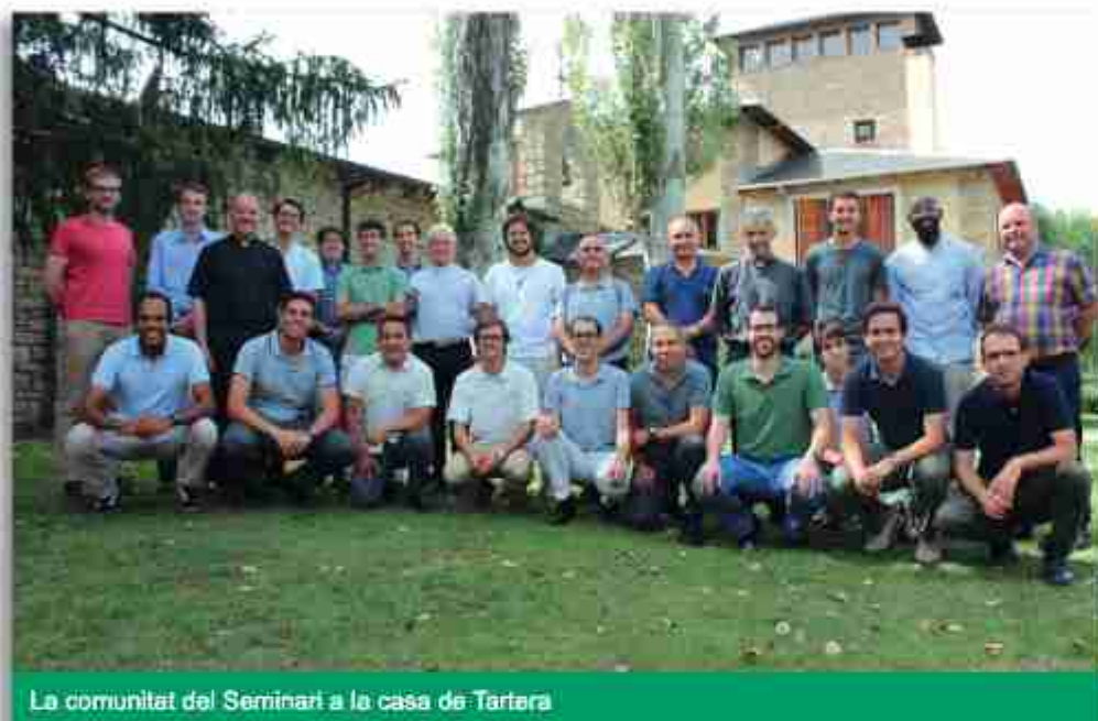
La comunitat del Seminari a la casa de Tartera