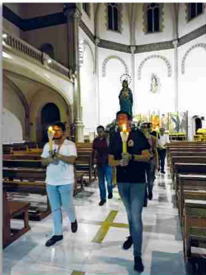
Sortint en processó de la capella del Seminari.

«El Rosari, encara que es distingeix pel seu caràcter marià, és una oració centrada en la cristologia. En la sobrietat de les seves parts, concentra en si la profunditat de tot el missatge evangèlic, del qual és com un compendi». Així ens parla la introducció la Carta apostòlica Rosarium Virginis Mariae , de sant Joan Pau II, sobre el Sant Rosari.