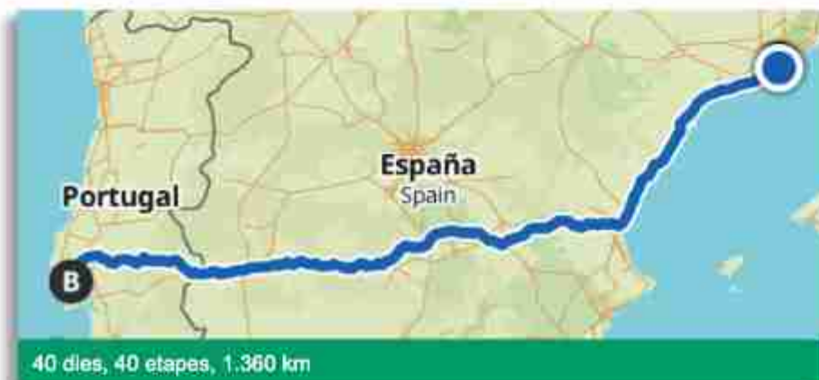
40 dies, 40 etapes, 1.300 km