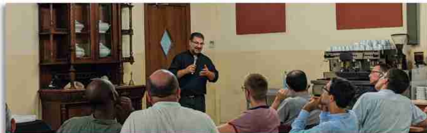
Unes paraules finals