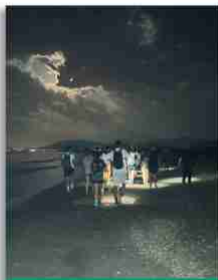
Sortint d'Alcossebre (Castelló) fent camí de nit vora el mar. 9a etapa, d'Alcossebre a Bancàssim (30 km)

Mentrestant, els joves de la parròquia s'anaven engrescant en l'aventura que, certament, era un repte: 40 dies, uns 1.300 km... amb les incomoditats pròpies del peregrí i amb alguna que altra norma pròpia del grup, com és per exemple el dejuni de telèfon mòbil. «Podré viure sense mòbil 40 dies? Sí! I més, encara!». A més, els joves de la parròquia van fer diverses recaptades durant l'any per ajudar a pagar les despeses de la peregrinació.